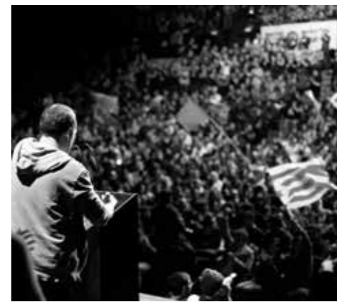
Acte central de la CUP-AE a Barcelona

Entre les ciutats majors de 20.000 habitants els millors resultats van ser precisament a Vilanova i la Geltrú, Molins de Rei (6,31%), Vilafranca del Penedès (6,25%), Sant Pere de Ribes (6,06%) i Valls (5,70%). També cal destacar el 5,6% de Girona –on la CUP té tres regidors– i el 5,3% de Reus, entre altres. Al conjunt del Principat en dues poblacions la CUP-AE va ser segona força: la Vilella Alta (Priorat) i Sales de Llierca (Garrotxa).